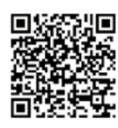
「ラーケーションの日」活動事例集