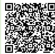
「ラーケーションの日」ポータルサイト

「ラーケーションの日」には、様々な活動ができます。どのような活動ができるのか、どうやって「ラーケーションの日」を取ればよいのかなど、興味をもった人は、おうちの方に配った「保護者用リーフレット」を見たり、右の二次元コードから、「ラーケーションポータルサイト」の「『ラーケーションの日』活動例」を見たりしながら、おうちの方と話し合ってください。