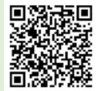
「ラーケーションの日」活動例