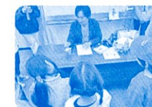
《イラスト教室の様子》