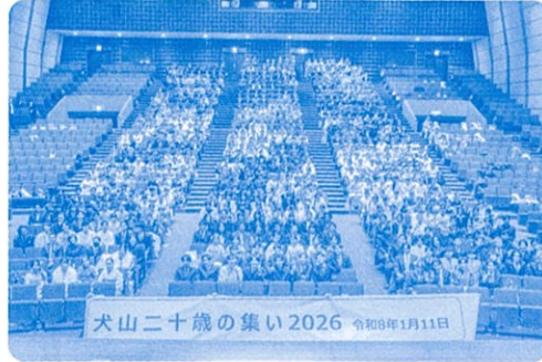
〈二十歳の集い2026 全体写真〉

「犬山二十歳の集い2026」の際には、多くの企業様より協賛金、協賛品を頂くことで会を盛り上げることができました。ありがとうございました。