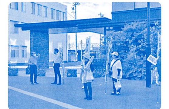
〈市長も参加の犬山駅西口の様子〉

☆この他にも年間を通じ、各地で所属団体が「おあしす運動プラスワン活動」を実施します。