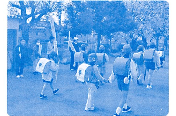
〈楽田小でのおあしす運動の様子〉

令和8年度がスタートし、新しいランドセルや制服、スーツで登校や出勤している皆さんを犬山市内のいろいろな場所で見かけます。そんな皆さんにおあしす運動で朝のあいさつをすると、皆さんが明るい笑顔であいさつをしてくれています。不安と期待いっぱい4月がスタートし、まだまだ新しい環境には慣れないと思いますが、明るい笑顔であいさつをしてくれます。昨年度、市内小学生が作ったおあしす(あいさつ)標語に『あいさつで 地域を笑顔に できるんだ』、『あいさつで 笑顔あふれる 町づくり』があり、おあしす運動を通してあいさつの大切さをあらためて実感することができました。また、これからもおあしす運動を続けていくことで『地域の輪 あいさつすれば 広がるよ』となっていくことを願っています。