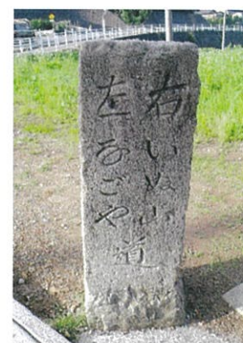
木曽街道道標 (清水)