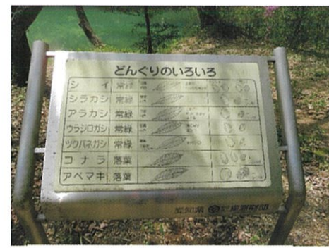
大洞池休憩所の案内板