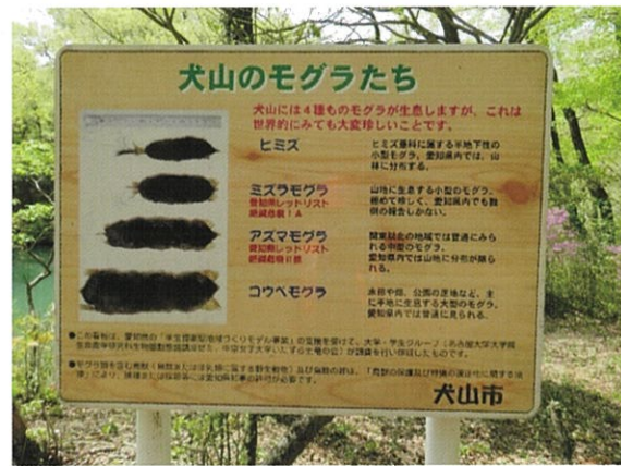
大洞池休憩所の案内板