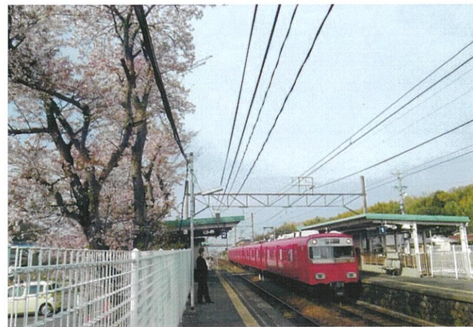
名鉄広見線善師野駅は善師野宿・東海自然歩道に便利