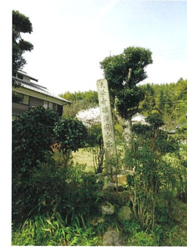
堀澤周安先生生誕地