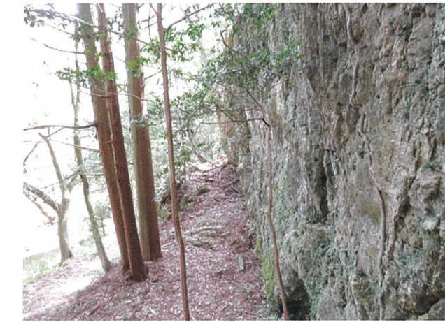
大洞池手前の磐座 (いわくら)