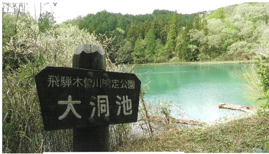
東海自然歩道 憩いの場所