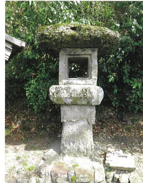
熊野神社 善師野の石で作られた灯籠